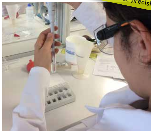
Pipetage de précision