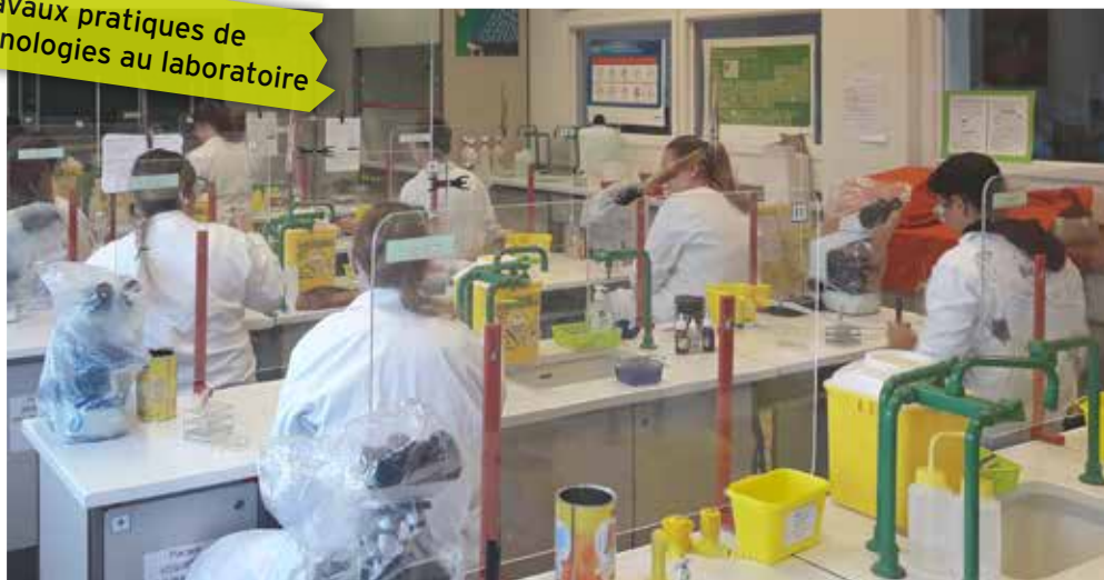
Travaux pratiques de biotechnologies au laboratoire

Accessible à la suite d'une seconde GT, ce baccalauréat conduit à une poursuite d'études