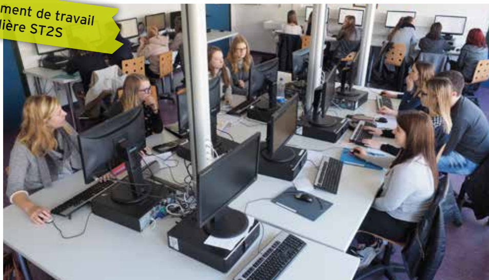
Environnement de travail en filière ST2S

Accessible à la suite d'une seconde GT, ce baccalauréat conduit à une poursuite d'études