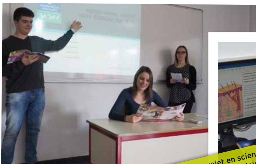
Equipe projet en sciences sanitaires et sociales