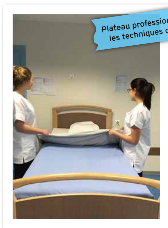
Plateau professionnel pour les techniques de soins

Accessible après la 3 e , ce baccalauréat forme à un métier en 3 ans mais surtout à une poursuite d'études